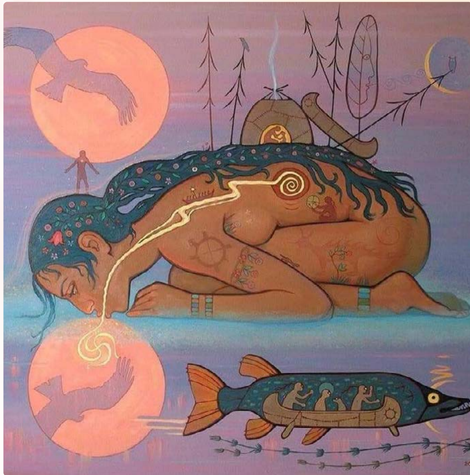
Kunstenaar: Vasil Woodland

De zalm zei: "Geef het aan mij. Ik zal het verbergen op de bodem van de oceaan."