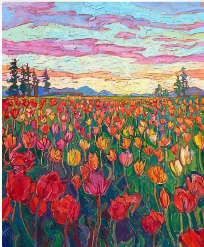
Gracias A La Vida