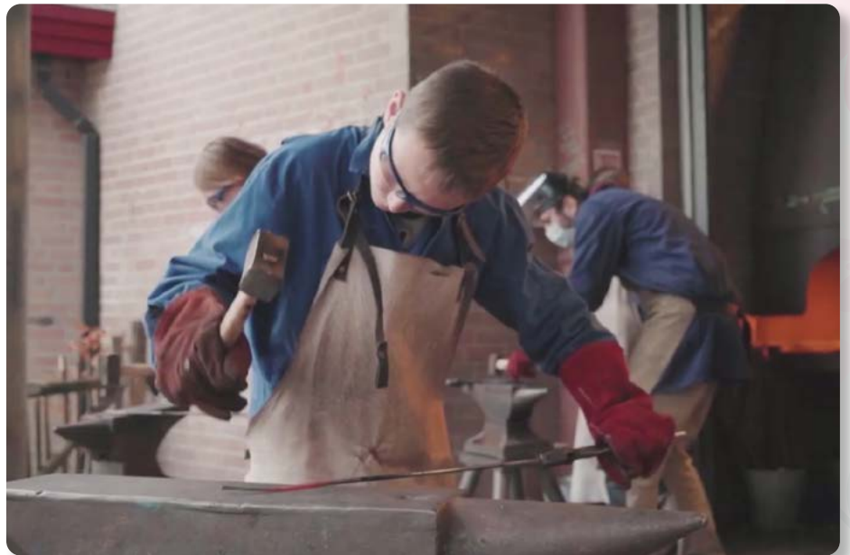
Foto: IJzersmeden op het Geert Groote College Amsterdam (GGCA), screenshot uit een informatieve video

Daarvanuit kunnen vervolgstappen worden gezet, daarom is het