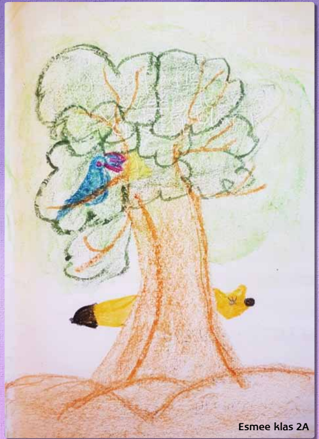
Esmee klas 2A

De raaf was te trots op zijn veren dos Opende zijn kaken, zong... En de kaas werd de buit van de vos