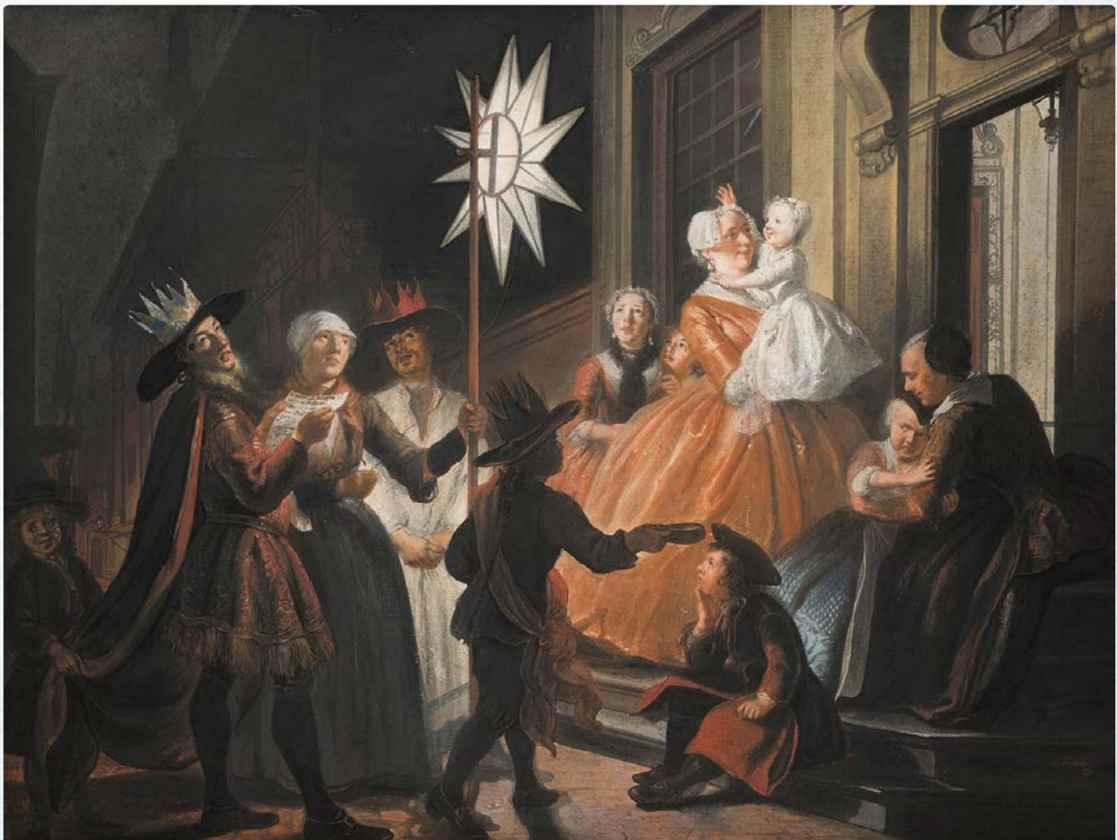
Cornelis Troost, ca 1740